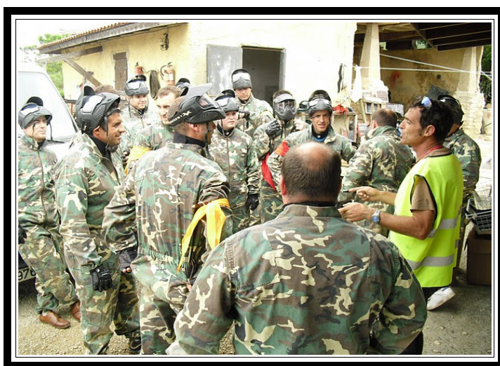
Monitor realizando las explicaciones previas.

¡Cuidado! Puede haber un ataque por sorpresa en el que habrá que eliminar a los emboscados que nos están esperando en el bosque con marcadoras especiales o tendremos que atacar su base.