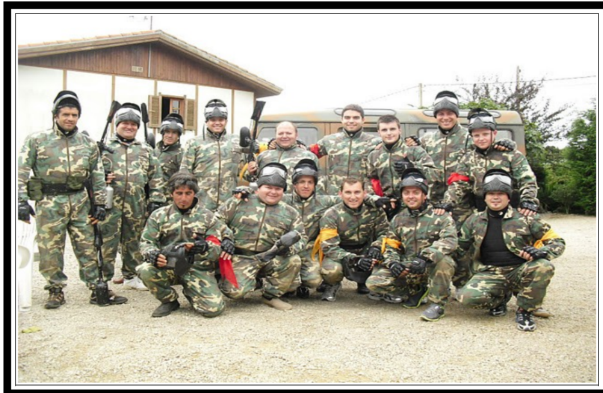
Grupo de amigos en una Despedida de Soltero.