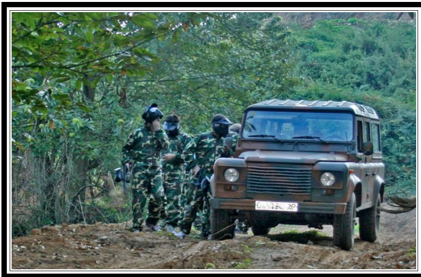
Un grupo de chicos en plena misión.

Si al terminar te quieres cambiar y asear dispones de vestuarios , recuerda que necesitarás también ropa de recambio y útiles de ducha.