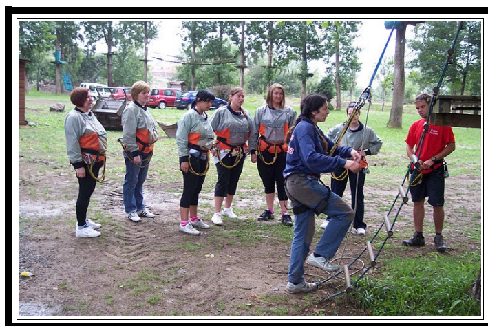
Monitora realizando las explicaciones previas.

El parque está especialmente pensado y diseñado para que todos podáis disfrutar de él, independientemente de la edad o de la preparación física.