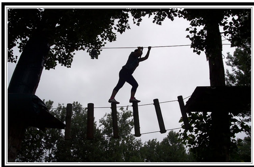
Novia realizando un tramo del recorrido.

Si al terminar te quieres cambiar y asear dispones de vestuarios , recuerda que necesitarás también ropa de recambio y útiles de ducha.